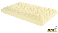
Kopfkissen Acquacell Soap