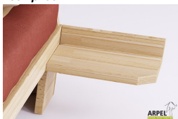
Comodino zen sospeso semplice