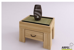
Comodino zen tatami